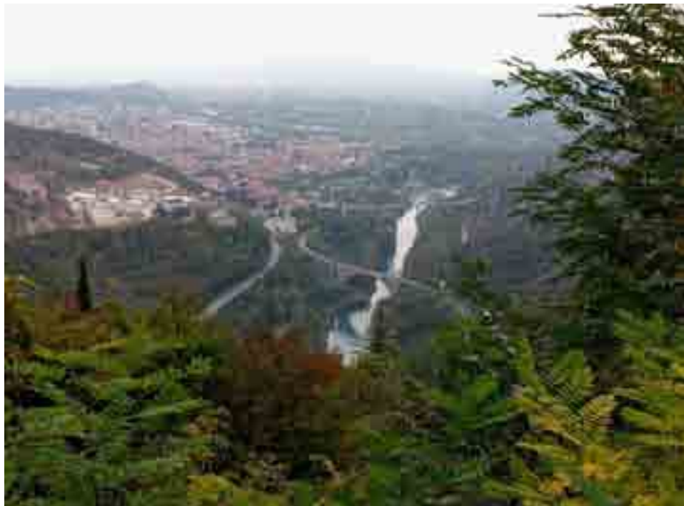
Veduta aerea del territorio goriziano con il fiume Isonzo

tica da disegnare un percorso ineludibile. Ed infatti, non appena gli strumenti regolamentari comunitari lo permisero, la pragmaticità è la intelligenza degli amministratori locali