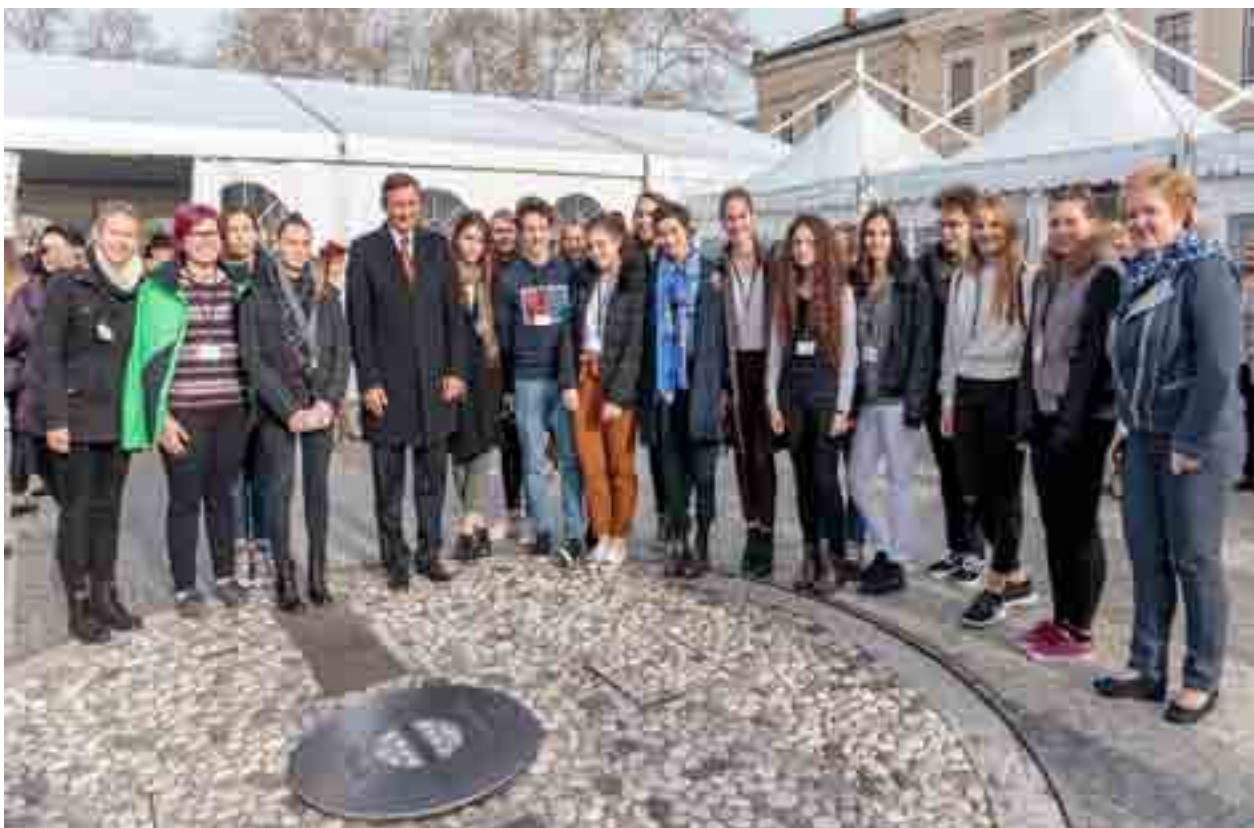
Il confine tra Italia e Slovenia che, grazie all'Unione Europea, non ha più la rete metallica che fino a qualche tempo fa divideva le due città di Gorizia e Nova Gorica.

Nec recisa recedit , recita un glorioso motto (della Guardia di Finanza, n.d.r.) che può applicarsi, senza remore, anche al territorio del goriziano e della goriska, capaci di risorgere dopo tragedie epocali e di farlo con virtù esemplari.