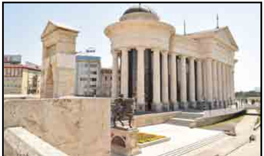
Due immagini di Skopje