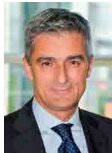
Giovanni Buttarelli, Garante europeo della protezione dei dati