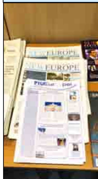
Più Europei, distribuito al Brussels Europe Press Club

Ass.ne Culturale "Rocca D'Oro" Via Cavour, 51 - 03010 Serrone (Fr) 335.53.26.888