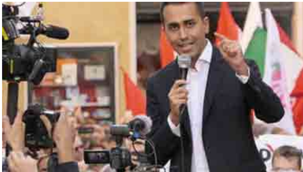
Luigi Di Maio

Ma quali modifiche apporterà alle regole sul diritto d'autore il testo criticato dal leader del Movimento 5 Stelle? In particolare Di Maio ha puntato il dito contro due articoli della riforma approvata per