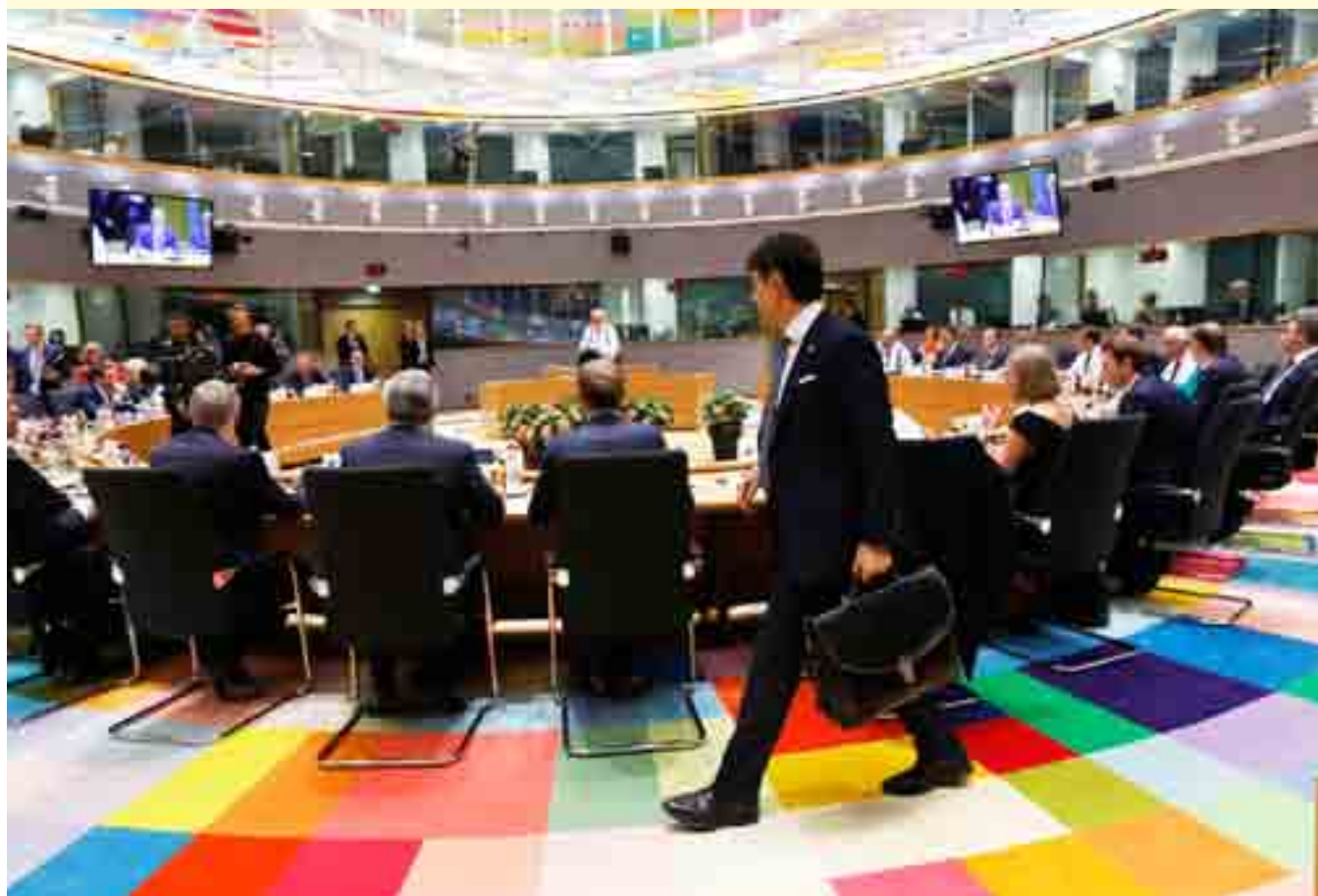
Il premier Conte entra nella sala dei 28

la cui gestione sarebbe rimasta al Paese di primo ingresso. Ma questo è avvenuto in novembre. Sei mesi dopo, nel cosiddetto contratto di governo, Lega e Cinque Stelle hanno condiviso nella sostanza il progetto di riforma europeo. Che ha in ogni caso il merito di una proposta con un'ottica europeista, che sancisce l'obbligatorietà di una responsabilità condivisa con quote ripartite proporzionalmente secondo popolazione e Pil. Ci sono anche dei vantaggi di riflesso, perché sarebbe velocizzata la procedura delle richieste d'asilo. Riforma approvata dal Parlamento, che poteva essere discussa al vertice di Bruxelles: per approvarla non sarebbe stata necessaria l'unanimità, ma la maggioranza qualificata dei 28. Riforma accantonata, forse verrà affrontata in autunno. Forse.