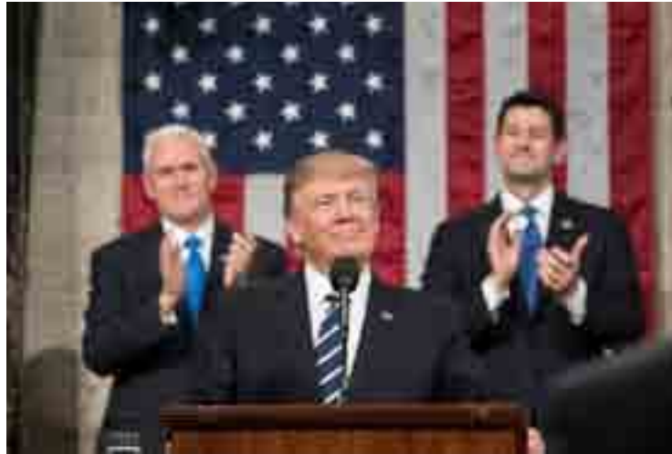
Il presidente Donald Trump

Il Commissario al Commercio Ue Cecilia Maistrorstrom ha affermato che "il commercio internazionale, che abbiamo svilup-