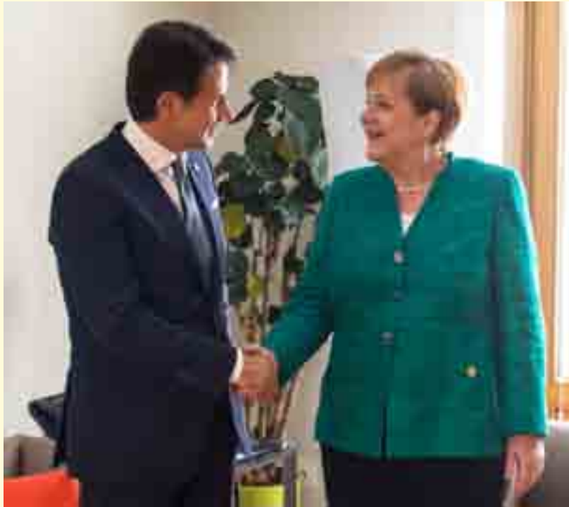
Il premier italiano Giuseppe Conte con la cancelliera tedesca Angela Merkel

secondo i dati del Viminale, i migranti sbarcati in Italia sono stati 13.340, -77,2% rispetto al